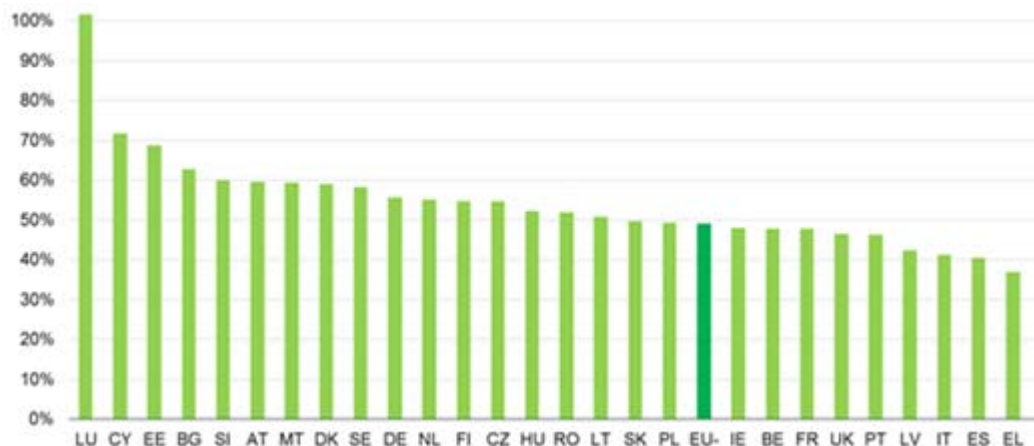
Wykres 1. Rzeczywiste dochody z podatku VAT w 2011 r. (odsetek teoretycznych dochodów według stawki podstawowej)

Przedstawiony odsetek dochodów z VAT obliczono jako rzeczywiste dochody z VAT podzielone przez iloczyn podstawowej stawki VAT i ostatecznego spożycia krajowego netto. Wysoka wartość dla Luksemburga wynika ze skali podatku VAT uzyskanego ze sprzedaży na rzecz osób niebędących rezydentami.